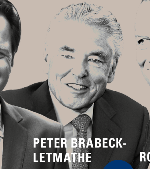
PETER BRABECK- LETMATHE